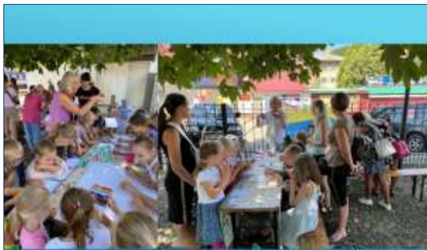
紛争で親を亡くした子どもたちのメンタルヘルス（折り紙教室）